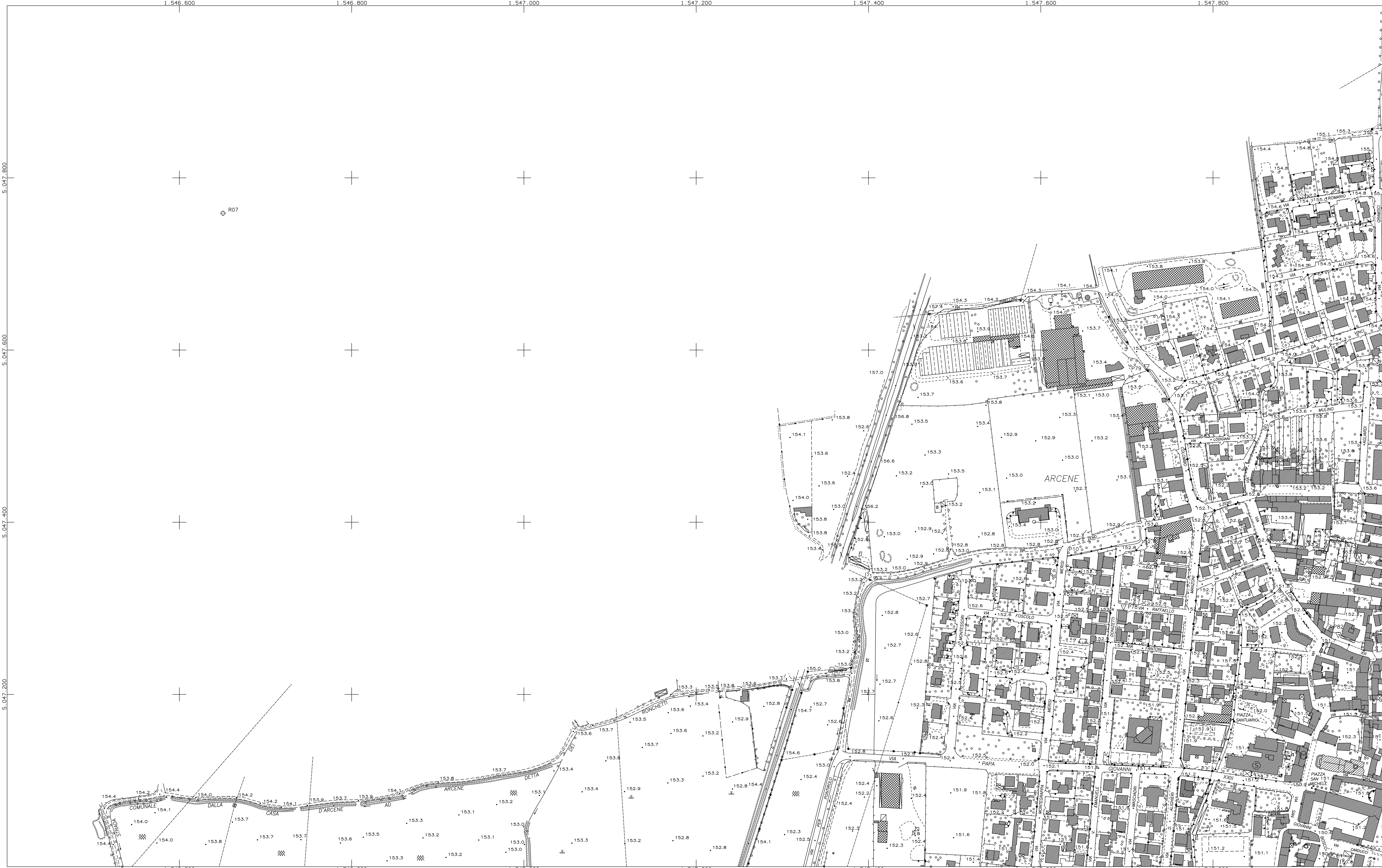
QUADRO D'UNIONE DEI FOGLI