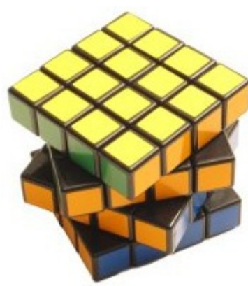
Risolto = no penalità Tutti disallineati \leq 45^\circ