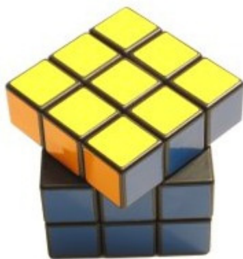
Risolto = no penalità Disallineamento \leq 45^\circ