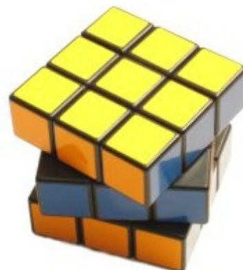
Non risolto 2 disallineamenti > 45^\circ