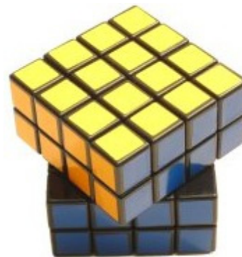
Risolto = no penalità Disallineamento \leq 45^\circ