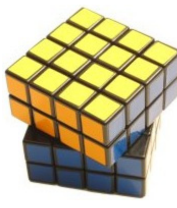
Risolto, con penalità 1 disallineamento > 45^\circ

10g) Per il Magic (e puzzle simili): deve essere appoggiato 'piatto' sulla superficie (tavolo). Perché la risoluzione venga considerata valida e priva di penalità la massima elevazione consentita del lato inferiore del puzzle rispetto al piano è quella pari allo spessore di due tiles del puzzle.