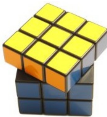
Risolto, con penalità Solo 2 parti disallineate > 45^\circ