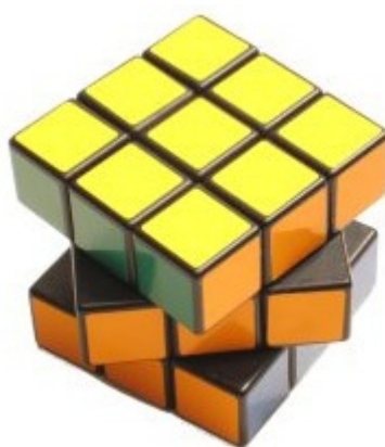
Risolto = no penalità Tutti disallineati \leq 45^\circ