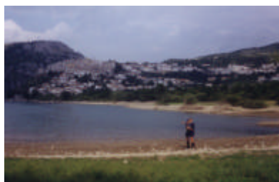
Ecco il luogo dove avveniva la consegna delle bustarelle!

cendo perdere i miei compagni nel bosco durante i giochi notturni, distruggendo le costruzioni, fare rotolare tronchi verso le latrine occupate....(anche se devo ammettere che è stato divertente)" La lettera è di un anoni-