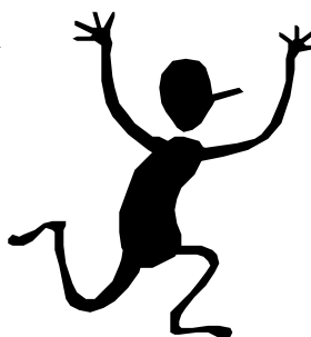
Arriva il mostro!

Questo di sicuro, gli avrà provocato degli squilibri mentali: epico